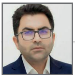
به قلم: پویا وکیلی