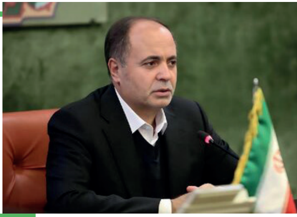
وزیر جهاد کشاورزی: